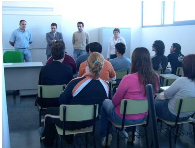
INAUGURACIÓN DE LA EMFE

CONSEJERIA DE EMPLEO DELEGACIÓN PROVINCIAL DE SEVILLA