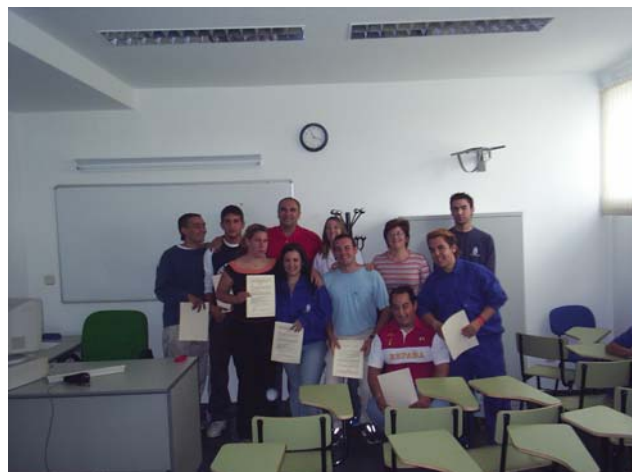
Alumnos, Monitor y ADL-

Ha sido un grupo de alumnos que en un 50% no habían cumplido la mayoría de edad al terminar el curso. Es decir muy jóvenes en relación al mundo del empleo. Debido a esta característica se ha hecho un gran esfuerzo durante todo el programa para situarlos en buena disposición en el ámbito del empleo.