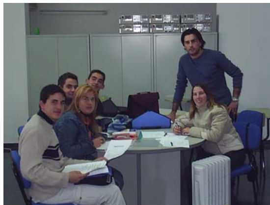
Alumnos en el Aula de Teoría